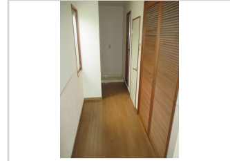
流し台は扉で隠せます。